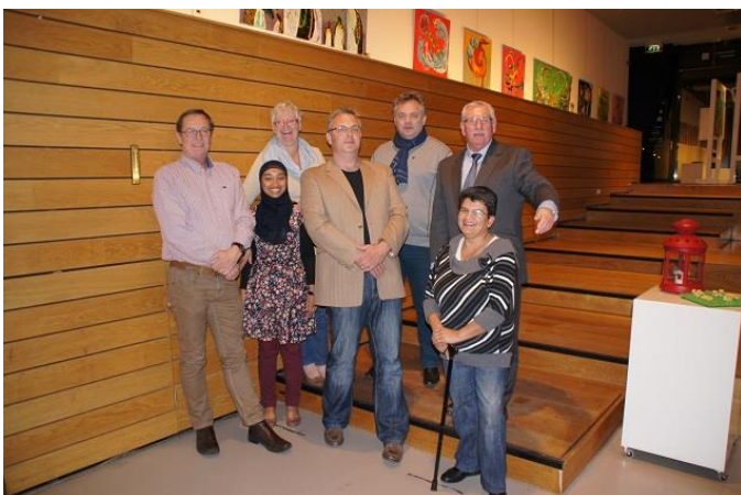
Bestuur van HBV De Woonkoepel Zwolle

Na een begrotingsoverzicht te hebben overgelegd, kan een bewonersvereniging op een bijdrage van HBV De Woonkoepel rekenen.