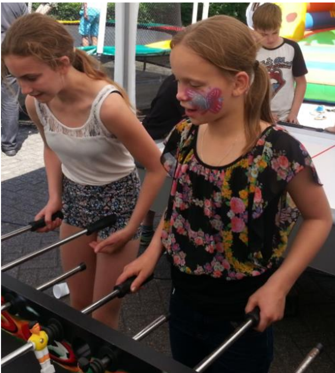
Geschminkt aan het tafelfootballen.