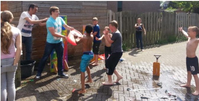
Het wordt nu een echt waterfestijn.