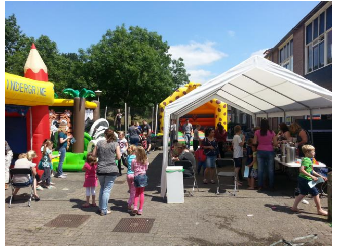
Wat een drukte, wat een gezelligheid.