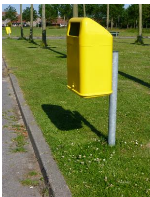
Een geadopteerde afvalbak

De adoptant zorgt er vervolgens voor dat zijn/haar adoptiefafvalbak(ken) tijdig wordt/worden geleegd .