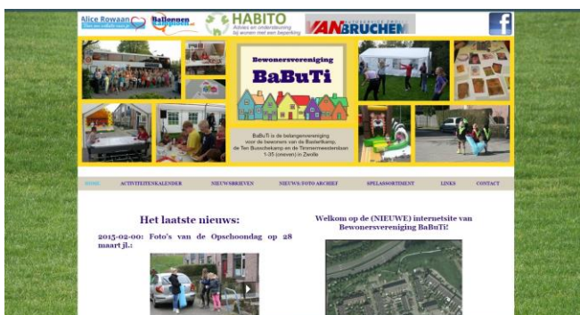
Screenshot nieuwe website BaBuTi

Vandaag is bij u de volledig vernieuwde nieuwsbrief van BaBuTi op de deurmat gevallen! Niet alleen heeft de nieuwsbrief een nieuwe kleur gekregen, ook het logo is vernieuwd, zoals u hierboven ziet. Onze nieuwe huiskleur is van lichtblauw in geel veranderd, wat dus ook betekent dat de nieuwsbrieven vanaf nu op geel papier gedrukt worden - meteen beter leesbaar. Ook in het nieuwe logo zit de kleur geel. Omdat de oude website hard aan vernieuwing toe was, is die ook meteen geheel gemoderniseerd.