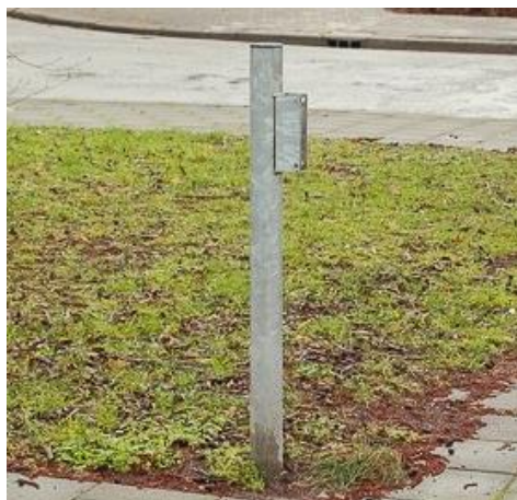
De paal waar de afvalbak (nu geel) weer aan bevestigd wordt.

Sinds eind 2014 is de gemeente in de hele stad bezig met het verwijderen van het grootste deel van alle door haar geplaatste afvalbakken (de palen bleven staan). De wijk Holtenbroek was als eerste aan de beurt (een pilot). Andere wijken volgden, waaronder Zuid. De bedoeling van de gemeente was om een heleboel geld te besparen op de lediging van de afvalbakken en het moeten vervangen ervan door vernielzucht. Omdat heel veel mensen bepaald niet blij zijn met de verwijdering van de afvalbakken door de gemeente (veel meer zwerfafval), maar de gemeente tegelijkertijd aangeeft financieel geen ruimte te hebben voor het blijven ledigen en vervangen van de afvalbakken, heeft ze het volgende bedacht: in de hele stad, dus ook in Zwolle Zuid en in onze buurt , kunnen mensen zich aanmelden om een of meer afvalbakken te adopteren . Wat houdt dat in? Als iemand aangeeft dat hij/zij een of meer afvalbakken wil adopteren, plaatst de gemeente de afvalbak ( nu geel ) weer terug op de plaats waar deze eerst aan een paal bevestigd was.