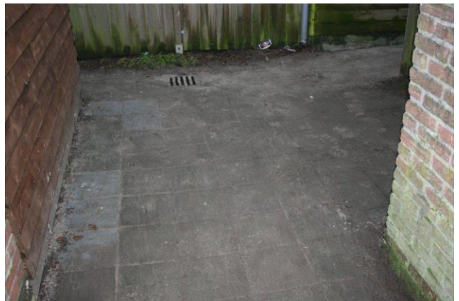
Een nieuwe afwatering en een betere bestrating.