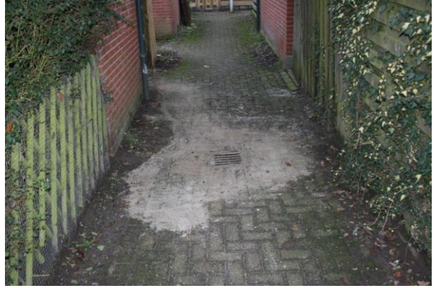
Een opgeknapte afvoer.