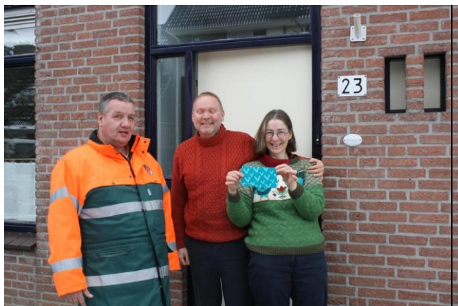
De familie Rowaan.