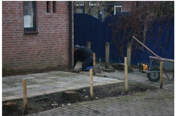
Hier wordt hard gewerkt!