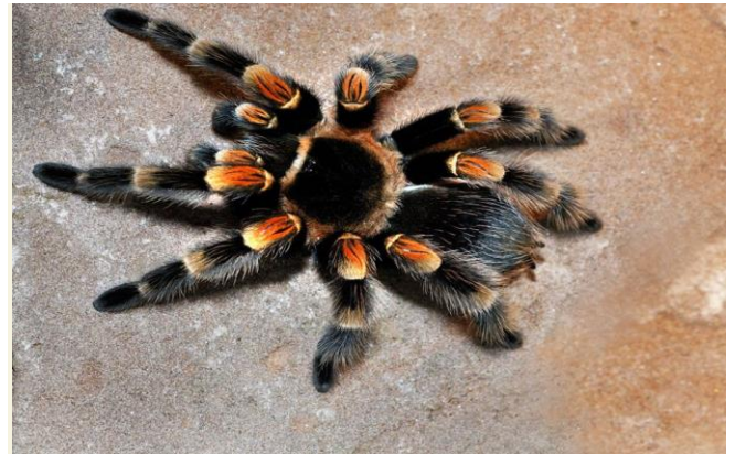
Een giftige spin in de woestijn