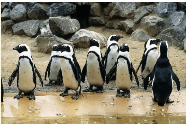
Pinguïns: statige dames en heren