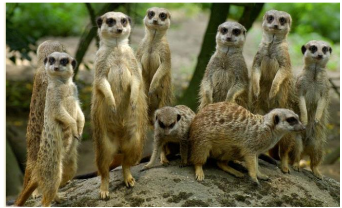
De familie stokstaartjes

Bij deze Nieuwsbrief treft u een aantal bijlagen aan.