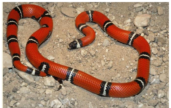
Een slang in de woestijn