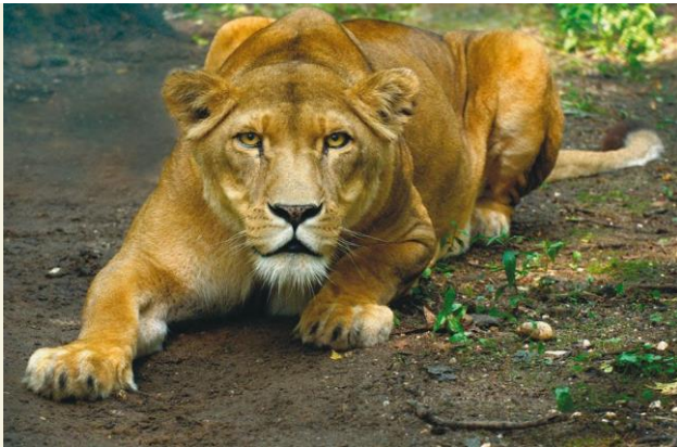
Leeuw: klaar voor de sprong?