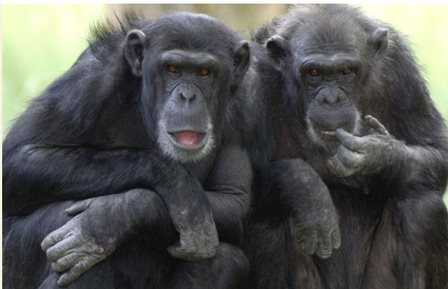
Apen: aapjes kijken.....